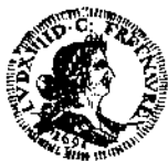
FIGURE des Pièces de quatre sols nouvelles.